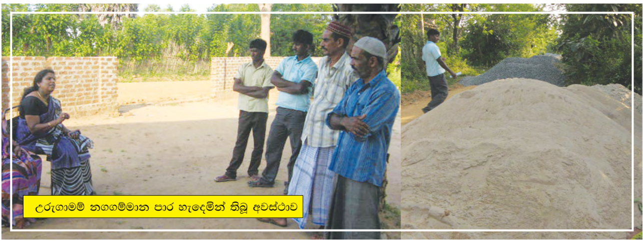
උරුගාමම් නගගම්මාන පාර හැඳුමින් තිබූ අවස්ථාව

මන්මුණේ දකුණු ඒරාමුල්පත්තු ප්‍රාදේශීය සභාව විසින් ඒරාමුල් ගම්මානයේ කනත්ත පාර පිළිබඳ තීරණ ගැනීමේදී වැව් ආසන්න ප්‍රදේශය ගංවතුරට යටවන හෙයින් පාර අබලන් වනු ඇතැයි යන්න සමාජ විගණන කමිටුව විසින් පෙන්වා දෙනු ලැබීය. රැස්වීම්වලදී මේ පිළිබඳ විස්තර ඉදිරිපත් කරමින් ව්‍යාපෘති තක්සේරු කමිටුවට වැඩබිමට පැමිණ පරීක්ෂා කරන්නැයි ඉල්ලා