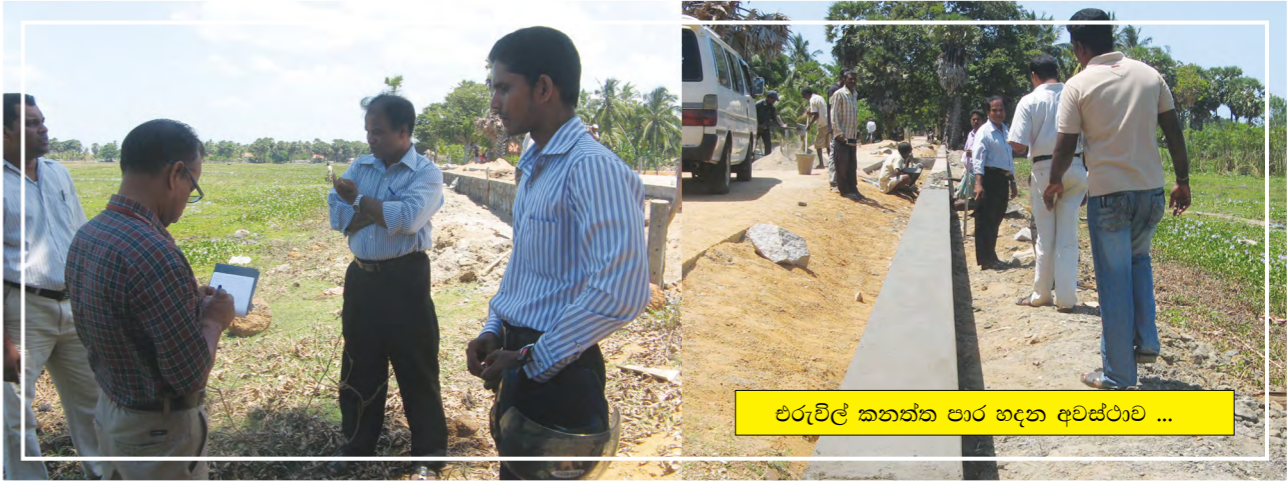
ඒරාමුල් කනත්ත පාර හඳුනා අවස්ථාව ...

සිටියේය. එහි ප්‍රතිඵලයක් වශයෙන් වැව පැත්තෙන් ආරක්ෂක බැම්මක් ඉදිකරවීමට කටයුතු යෙදීය.