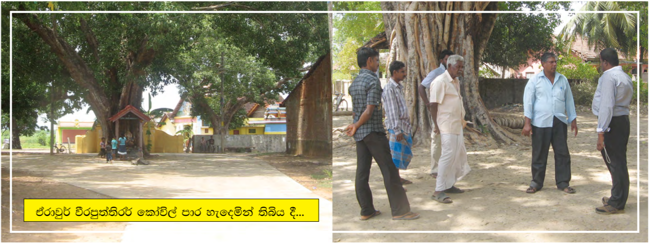
ඒරාමුල් විරපත්තිරි කෝවිල් පාර හැඳුමින් තිබිය දී...

සේවා සැපයුම් හැකියාව පිළිබඳ සමාජ විගණන කමිටුව විසින් තක්සේරු කොට 'සමාජ ලකුණු සටහනක්' සකසා එය එම ප්‍රාදේශීය සභාව වෙතත් මඩකලපු දිස්ත්‍රික් පළාත් පාලන සහකාර කොමසාරිස් වෙතත් ලබා දී තිබේ. පෝරතීටුවත්තු ප්‍රාදේශීය සභාවේ